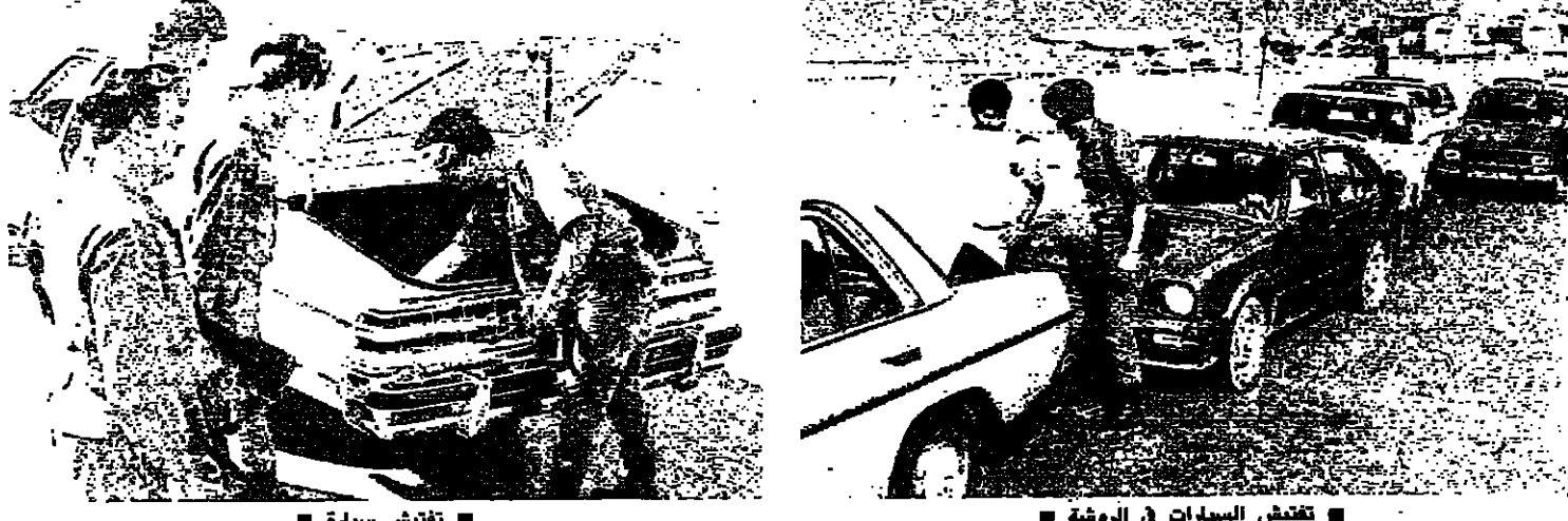
تفتيش السيارات في الروشة

وتنفيذاً لقرارات لجنة التنسيق الأمنية في بيروت الغربية، تنفيذاً لما تقر في اللازم الإسلامي الأخير في دمشق، وذلك بشرف لجنة التنسيق التي يرأسها الرئيس رشيد كرامي وبمشاركة وإشراف فريق المراقبين السوريين وممثلي الفرقاء. وتنفيذاً لقرارات لجنة التنسيق الأمنية الأولى وبشرف الاستعدادات الأمنية صباح أمس وإنهت قوى الأمن الداخلي جميع عناصرها في الخطة صباحاً وبشكل كامل في كافة الأحياء في بيروت الغربية، مثل قوى الأمن الداخلي في اللجنة الأمنية التابعه عن مكاني وأمري القوي والسرايا والدوريات. وقالت مصادر قوى الأمن الداخلي إن ٢٨ دورية من سورية الطوارئ انطلقت من كافة الأحياء في الساعة السابعة صباحاً وبشرت أعمال الدوريات صباحاً في مختلف أنحاء بيروت الغربية قوام كل واحدة منها أربعة عناصر ويجري تنفيذها وتوقيتاً كل ست ساعات في شكل متواصل. وأضافت المصادر أن هذه الدوريات تأسس بتوجيهات قائد السرية الإقليمية في بيروت المقدم رفيع زيدان يعاونها ألفريد فليز رحال. وتلقت هذه الدوريات أوامر واضحة بصحابة كل سلاح ظاهر ومع الظهور باللباس العسكري، من دون أن تحصى أوامر بالبقاء الحواجز وأعمال تفتيش السيارات وسحب المخالفين إلى المراجع القضائية والأمنية المختصة. وقالت المصادر أن هذه الدوريات تتنقل بتفريدها ومشاهدتها إلى قيادة السرية الإقليمية التي تتعامل للمشاكل بالتعاون مع لجنة التنسيق والتي يعثل قوى الأمن الداخلي فيها العقيد عمر مكوي.